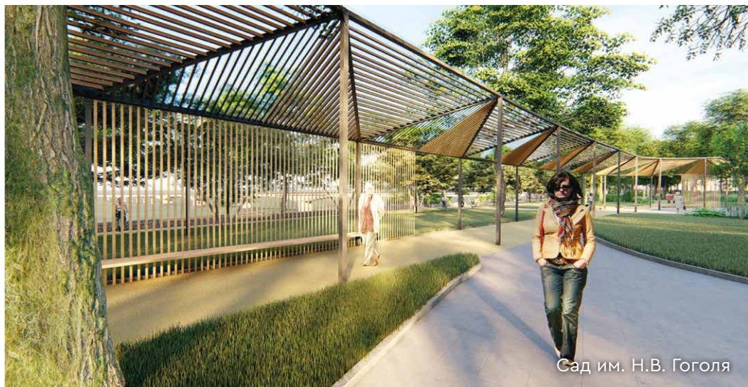
Сад им. Н.В. Гоголя

Голосование по выбору объектов благоустройства – это возможность каждого решить, какие изменения должны произойти в вашем городе.