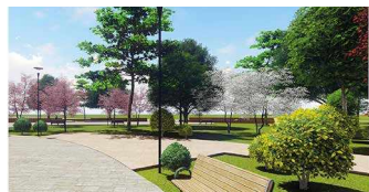
и другие объекты...