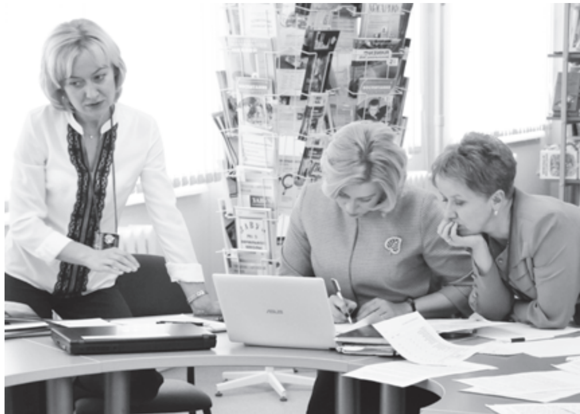
Победители конкурса получают право представить свой опыт на IV съезде учителей города Москвы

чить общепризнанным научным фактам, соответствовать федеральному государственному образовательному стандарту, этическим нормам и законодательству Российской Федерации.