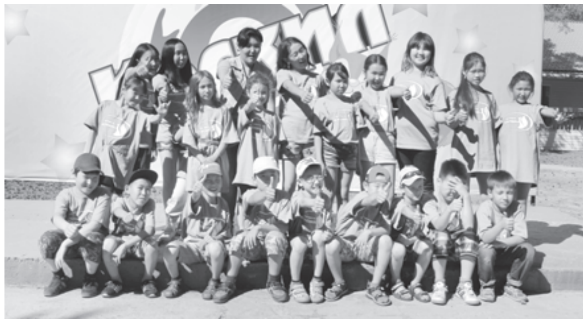
И юному дипломату, и юному экологу в Якутии найдется занятие по душе

Таким образом, больше детей смогут реализовать свои возможности, лучше подготовиться к жизни, к работе в условиях креативной экономики, чтобы стать конкурентоспособными, успешными гражданами страны.