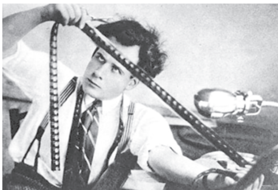
Сергей ЭЙЗЕНШТЕЙН заложил фундамент великого советского кино. Теперь дело за его наследниками

В рамках проекта кинофикации средних и малых российских городов из бюджета будет выделено 1,5 миллиарда рублей. Фонд кино в начале декабря объявил о старте конкурса на поддержку новых кинозалов в средних и малых городах России. Только на этот проект запланировано 700 миллионов рублей. При этом министр культуры выразил надежду, что в 2016 году Фонд кино просубсидирует на возвратной основе открытие новых кинозалов и в больших городах. Как отметил Владимир Мединский, в настоящее время в стране немногим более 3,5 тысячи современных кинозалов, в то время как в Америке их 35 тысяч. В России производится хорошее кино, но отсутствует возможность его показать, а те кинозалы, что имеются, забиты в основном голливудскими фильмами.