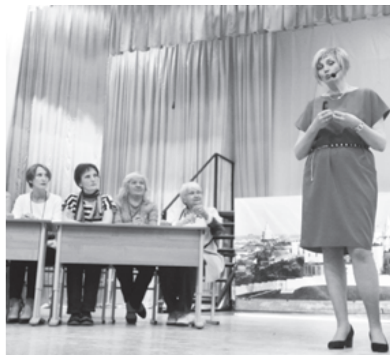
Цель конкурса - создание условий для эффективной самореализации педагога

- соответствие техническому регламенту и выбранной теме номинации Конкурса;