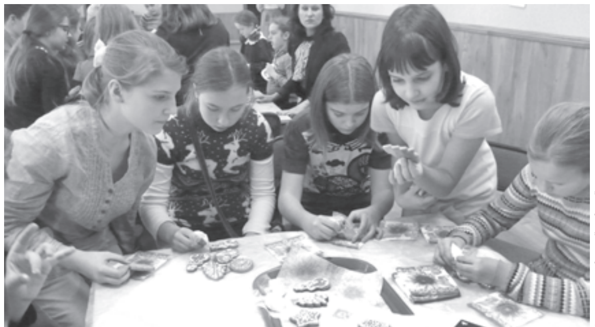
Проект - дело увлекательное!

3. Экспериментальная часть проекта выполняется на уроке. Это может быть составление анкеты и опрос, эксперименты, первичная обработка результатов по группам и их презентация. В выполнении проекта участвует весь