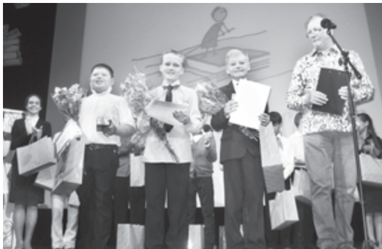
Актер Виктор БЫЧКОВ объявляет победителей конкурса «Живая классика-2015»

Еще одна премьера пятого сезона - официальное открытие нового интернет-портала «Живой классики», который объединит всех участников проекта прошлых лет. На сайте можно будет общаться, обсуждать прочитанные книги, смотреть образовательные вебинары и участвовать в онлайн-конкурсах.